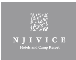
Hoteli Njivice d.o.o.