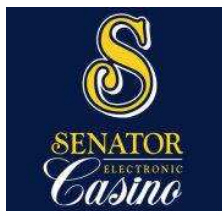
Adria Casino d.o.o. Turistička zajednica Crikvenica